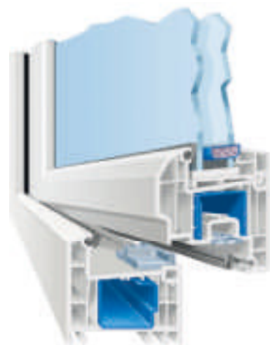
Systemschnitt Castello halbflächenversetzt