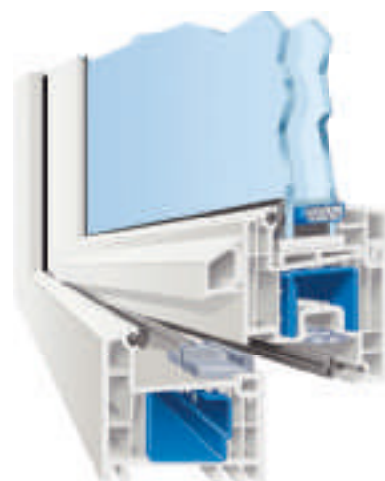
Systemschnitt Castello flächenversetzt